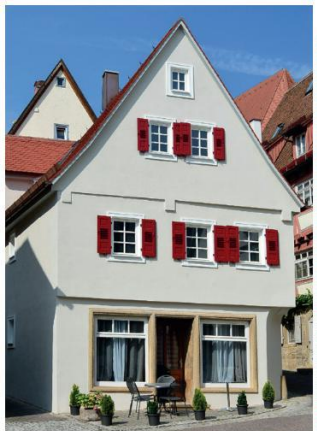
Vor der Modernisierung